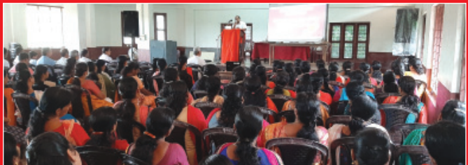
രക്ഷകർത്തൃ ബോധവൽക്കരണ ക്ലാസ്സ്